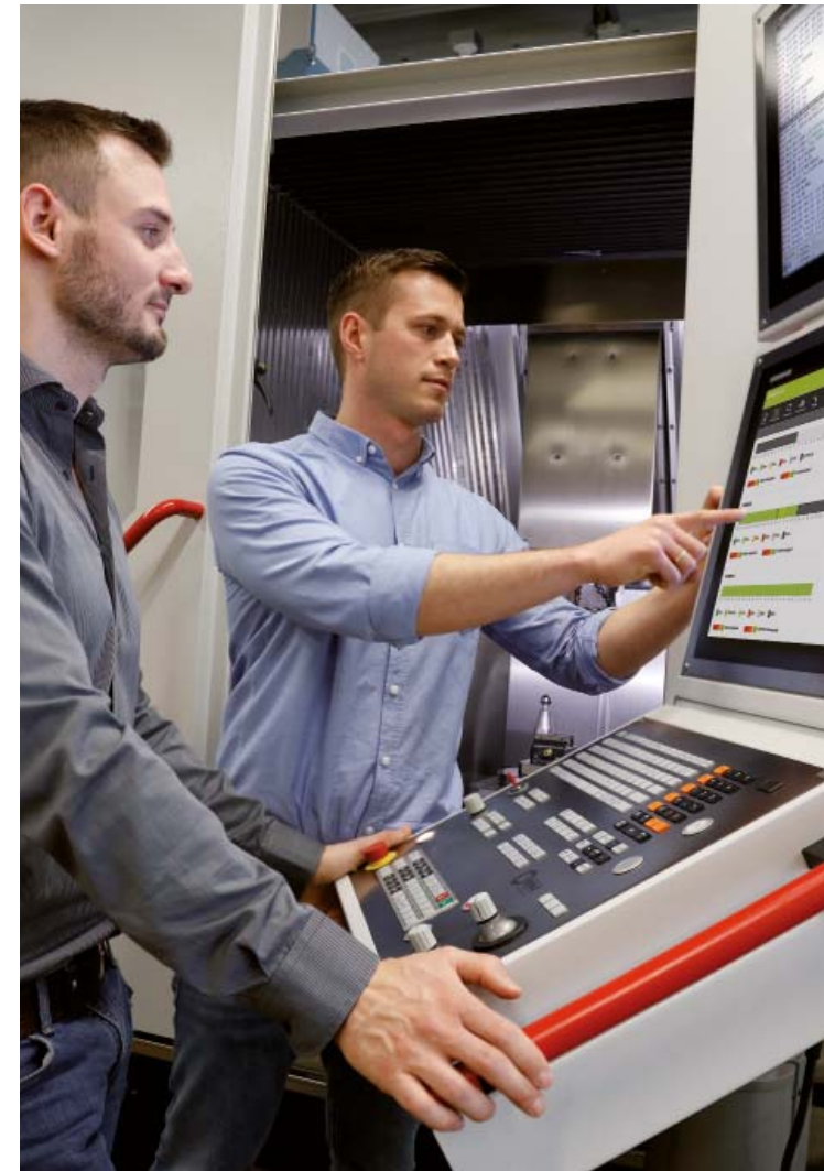
1075229-42 · 5 · 04/2018 · H · Printed in Germany